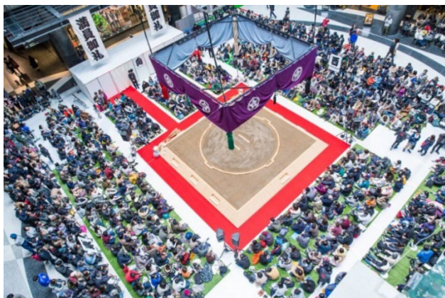
国体や地方巡業でも使われる本格的な土俵

北館1Fナレッジプラザの吹き抜け空間に土俵が出現。約5,000人の方々が、大いに盛り上がりました。