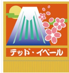
化粧まわしデザイン