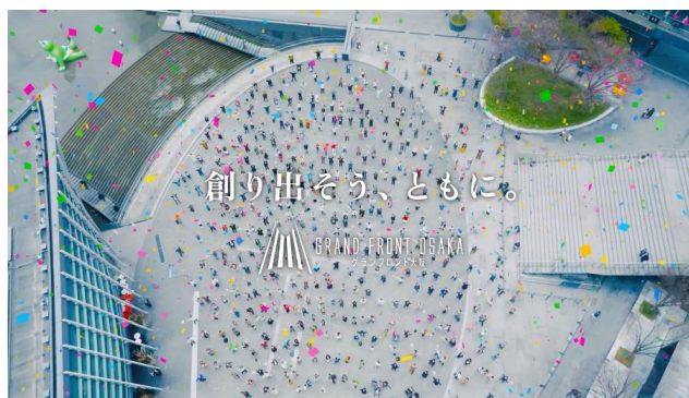
▲新ビジョンを表現した「GRAND VISION MOVIE」