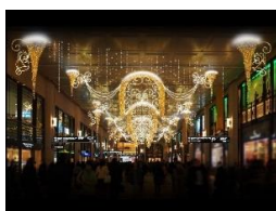
③梅田阪急ビル会場 (阪急サン広場)