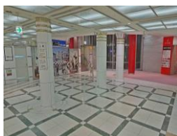
②ホワイトティウめだ会場 (サニーテラス)