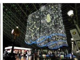
⑤大阪ステーションシティ会場 (時空の広場)