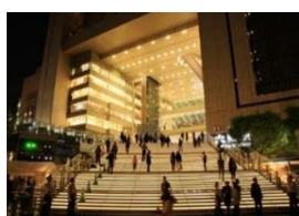
④グランフロント大阪会場 (うめきた広場)