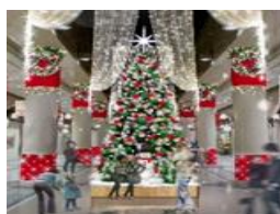
①ディアモール大阪会場 (ファッションナブルストリート)

聖歌隊のゴールとなる大阪ステーションシティ時空の広場では「Twilight Fantasy～光り輝く時空(とき)の海～」の点灯後、「HAPPY XMAS」を全員で合唱。その他、ステージイベントも開催。