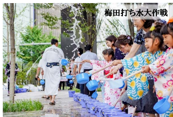
梅田打ち水大作戦

ゆかた姿で夏を満喫する！ゆかた祭を満喫する！写真を SNSで投稿頂いた方から抽選で素敵な賞品をプレゼント。