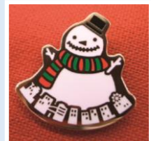
ピンバッヂを限定100個販売 (大阪ステーションシティ 時空の広場会場のみ)