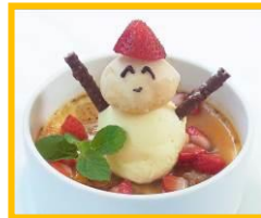
NU chayamachi プラス 3F 「Muu Muu Diner Fine Hawaiian Cuisine」