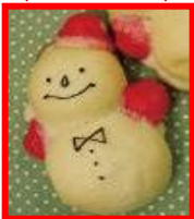
・阪急三番街 B1F 喫茶「ブルージン」 ・大阪新阪急ホテル 1F ラウンジ「プリアン」