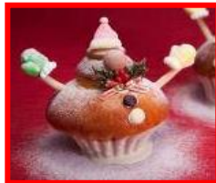
ヒルトン大阪 1F ロビー 「ジンジャーブレッドハウス」