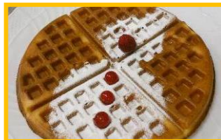
ディアモール大阪/ディアモール フィオレ 「マザーリーフ」