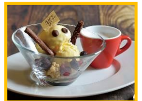
フリーゼフリーゼ B1F カフェ・ピストロ「ブーニャ ブーニャ」