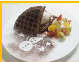
大阪ステーションシティ サウスゲート ビルディング 16F うまいものプラザ 「カフェ 英国屋」