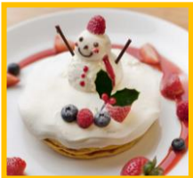
グランフロント大阪 ショップ&レストラン うめきた広場 B1F 「La Terrasse Café et dessert」