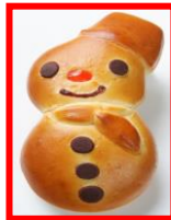
ウェスティンホテル大阪 ベストリーショップ 「コンディ」