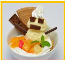
JR 大阪三越伊勢丹 10F ファミリーダイニング「テレポート」