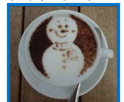
大阪ステーションシティ 5F 時空の広場「大阪ステーションシティ パール・デルソーレ」