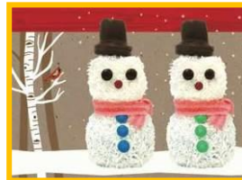
阪急32番街 空庭ダイニング 1F 「ロッキーマウンテンチョコレートファクトリー」