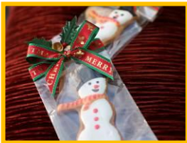
アルモニープラッセ大阪 10F 「アロンジ」