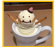
阪急三番街 B2F 「ミルクの旅」