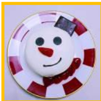
JR 大阪三越伊勢丹 10F フレンチカフェレストラン 「カフェ ラ・ポース」