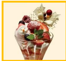
NU chayamachi プラス 2F 「かんみこより」