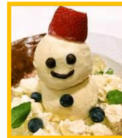
加茂梅田ビル 7F 「café&dining ESTADIO 梅田店」