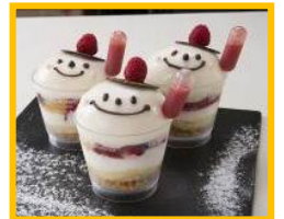
ルカア大阪 B1F 「パティスリー ラ テラス」