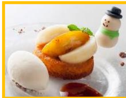
グランフロント大阪 バナソニックセンター大阪 2F 「FoodieFoodie」