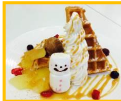
HEP FIVE 7F 「カラフルワッフル・フルフル」