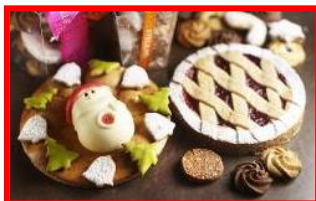
インターコンチネンタルホテル大阪 1F パティスリー「STRESSED(ストレス)」