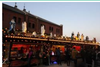
クリスマスマーケットイメージ写真

うめきた広場に「ヒュッテ(ヨーロッパ式の山小屋)」が登場し、クリスマスオーナメントやキャンドル、ヨーロッパ直輸入の木製人形などのクリスマスグッズのほか、ドイツプレミアムビールやホットワイン、ドイツ直輸入ソーセージやプレツェルなどの販売も行い、会場全体がクリスマスの楽しい雰囲気に包まれます。