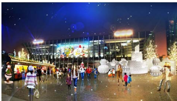
「うめきた広場」イメージ画像 (左:クリスマスマーケット、中央:スノーマン ライティング、右:WISH ART)

12月には、クリスマス本番を見据え、第二弾イベントを計画しておりますので、乞うご期待ください。