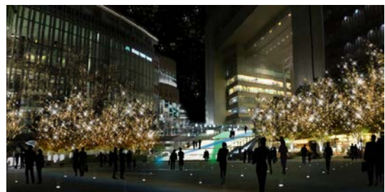
「うめきた広場」イルミネーションイメージ

従来型LED電球の3倍の照度を持つLED電球に電力をコントロールするシステムを加えることで、約1/3の使用電力で従来型LED電球と同等の明るさを得ることができる仕様で、従来品と比べ1球あたりの消費電力を65%削減する“エコイルミネーション”を使用しております。