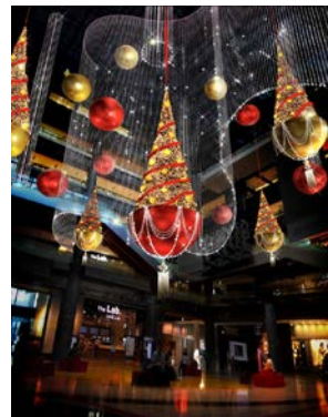
「WISH TREES」 In ナレッジプラザイメージ画像