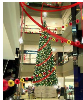
「南館4階クリスマスツリー」 イメージ画像

本イベント開催期間中、ショップ&レストラン各店ではスペシャルなクリスマスグッズや限定品、特別ディナーが用意され、クリスマスイベントも多数開催されます。