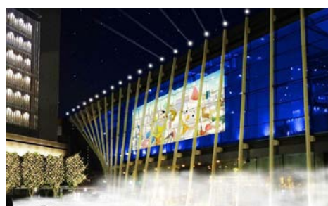
「スノーマンライティング」イメージ画像

グランフロント大阪会場では、メインコンテンツとなる光のイベントとして、うめきた広場に面する2階建の建物「うめきた SHIP」の壁面をスクリーンに見立て、光と音と映像がシンクロしたインタラクティブ技術を活用した“スノーマンライティング”を実施するほか、ナレッジプラザを中心に、週末に音楽ライブやワークショップを開催します。